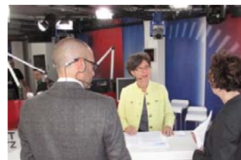
Maja Ingold im „Kreuzverhör“ der Parteien bei DRS 1 auf dem Bundesplatz